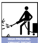
HIGH PRESSURE - ΥΨΗΛΗΣ ΠΙΕΣΗΣ