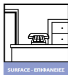
SURFACE - ΕΠΙΦΑΝΕΙΕΣ