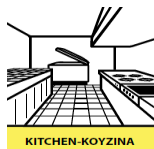
KITCHEN - ΚΟΥΖΙΝΑ